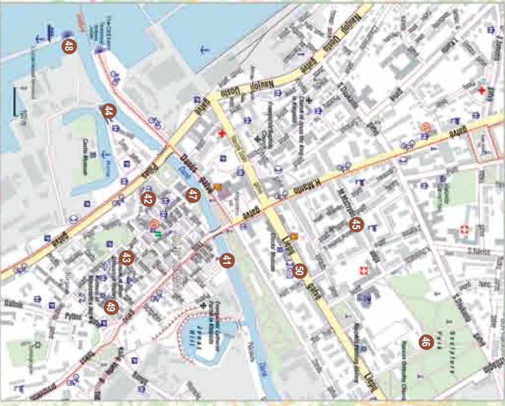
SUTARTINIAI ŽENKLAI / LEGEND